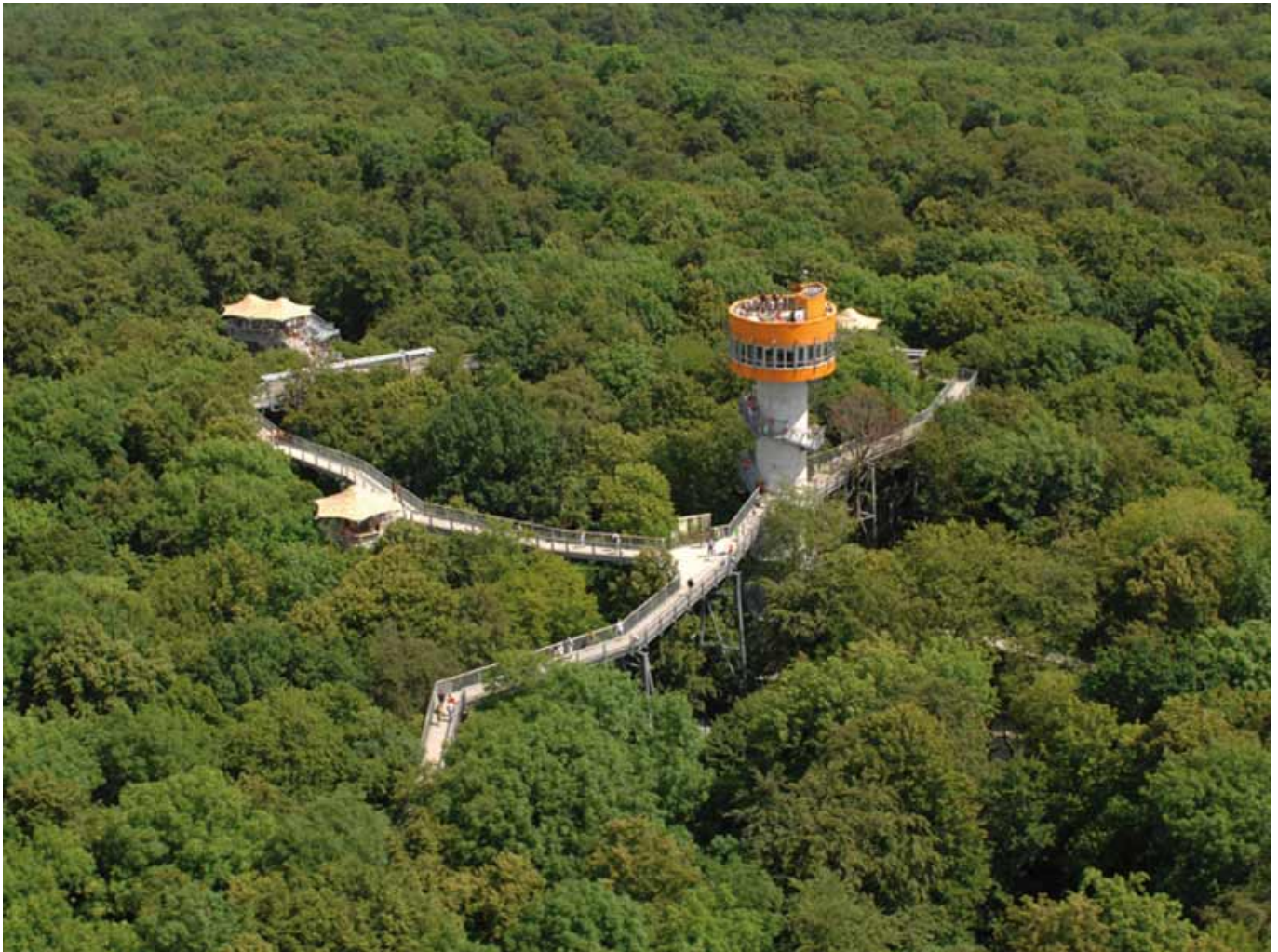
Kletterwald Hainich

Habt Ihr Lust dem Urwald aufs Dach zu steigen?