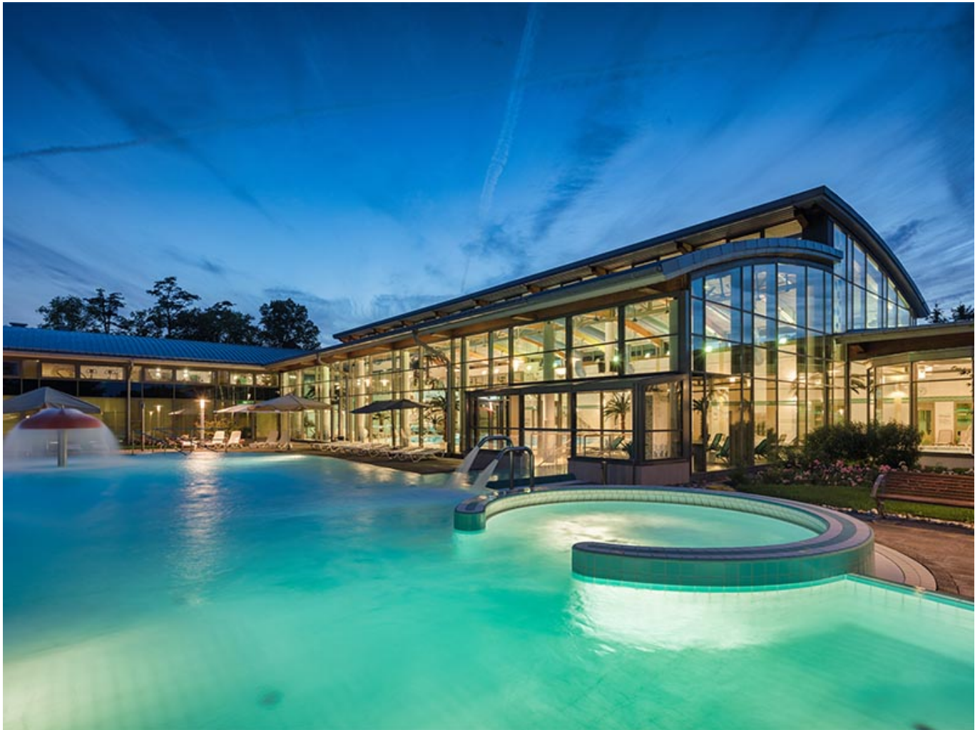
Friederiken Therme Bad Langensalza

Balsam für Körper und Seele ist ein Besuch in der Friederiken Therme in Bad Langensalza. Im Vertrauen auf die Wirkungsweise natürlicher Heilmittel setzt man hier auf sanfte Erholung.