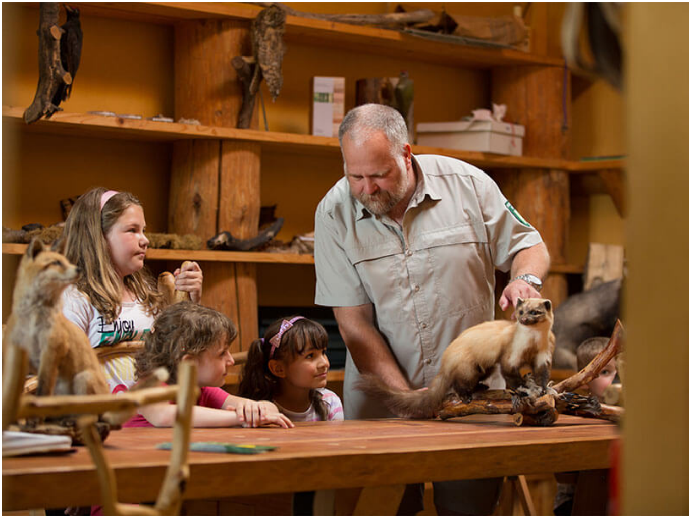
Umweltbildungsstation Nationalpark Hainich

An ausgewählten Sonntagen (siehe unten bei Öffnungszeiten) öffnet ein Ranger die Pforten und erklärt gerne alles, vom großen Rotfuchs bis zum kleinen Schachbrettfalter. Die „Grünen Klassenzimmer“ bieten Schulklassen bei einer geführten Fachführung und Nationalparkbesuchern die Möglichkeit, die verschiedenen Lebensräume des Waldes im Nationalpark Hainich kennenzulernen. Entlang eines Lern-Wanderweges stehen an interessanten Punkten Schilder, die Auskunft über die Naturphänomene vor Ort geben und manchmal auch etwas mehr als pures Wissen vermitteln.