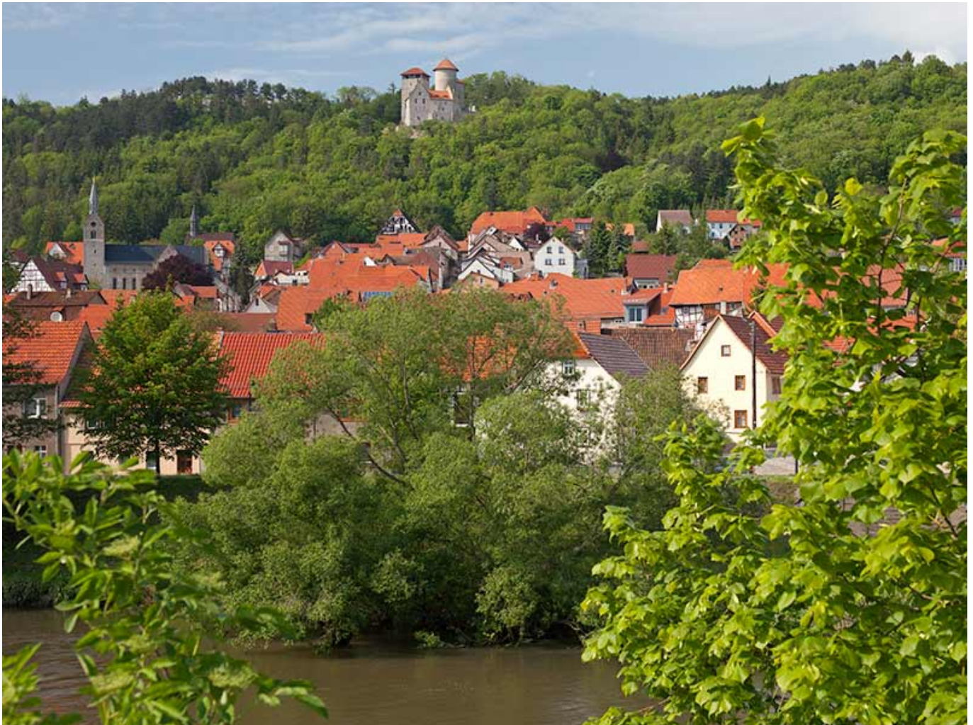
Treffurt mit der Burg Normannstein