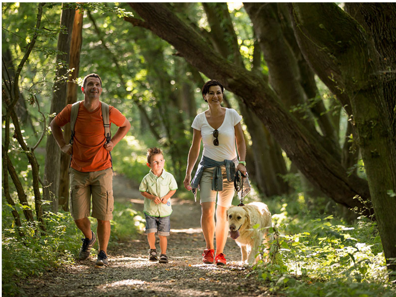
Wandern auf dem Hainichlandweg

Midden in de werelderfgoedregio Wartburg Hainich ligt een oerwoud met dichte, schaduwrijke beuken. Zeldzame dieren zoals wilde katten, vleermuizen, spechten en co. leven in dit afwisselend landschap.