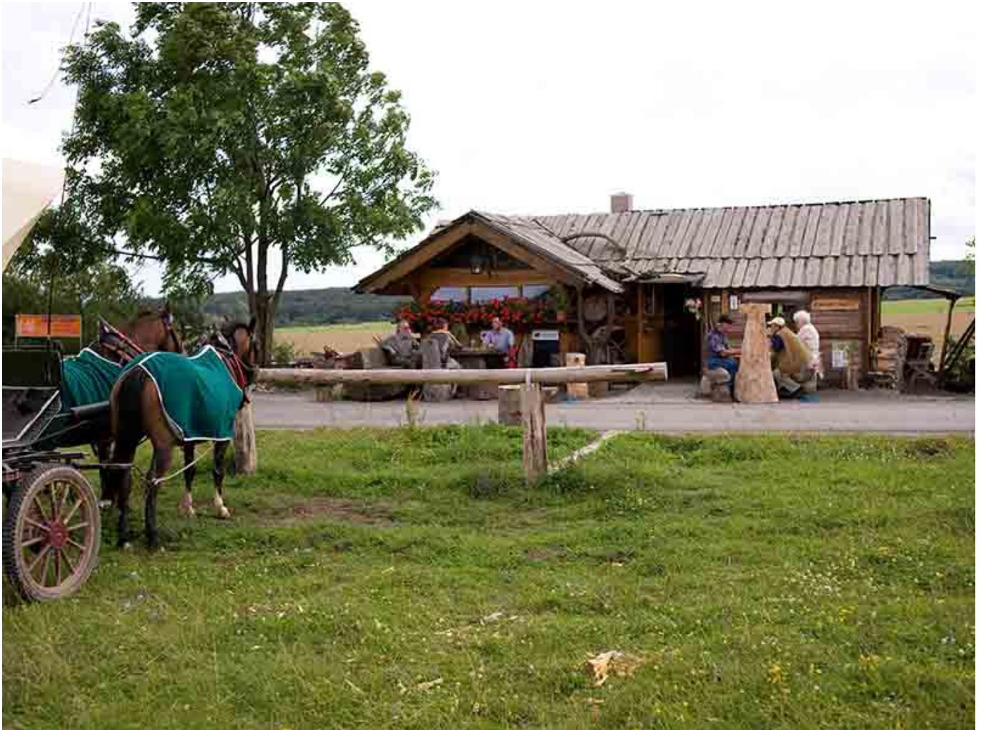
Hainichbaude am Craulaer Kreuz