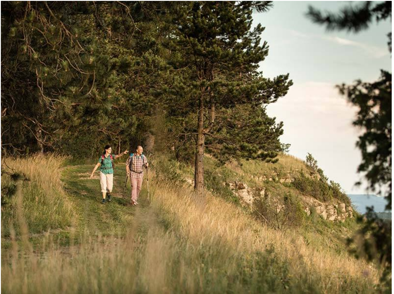
Natuurparkweg Leine-Werra