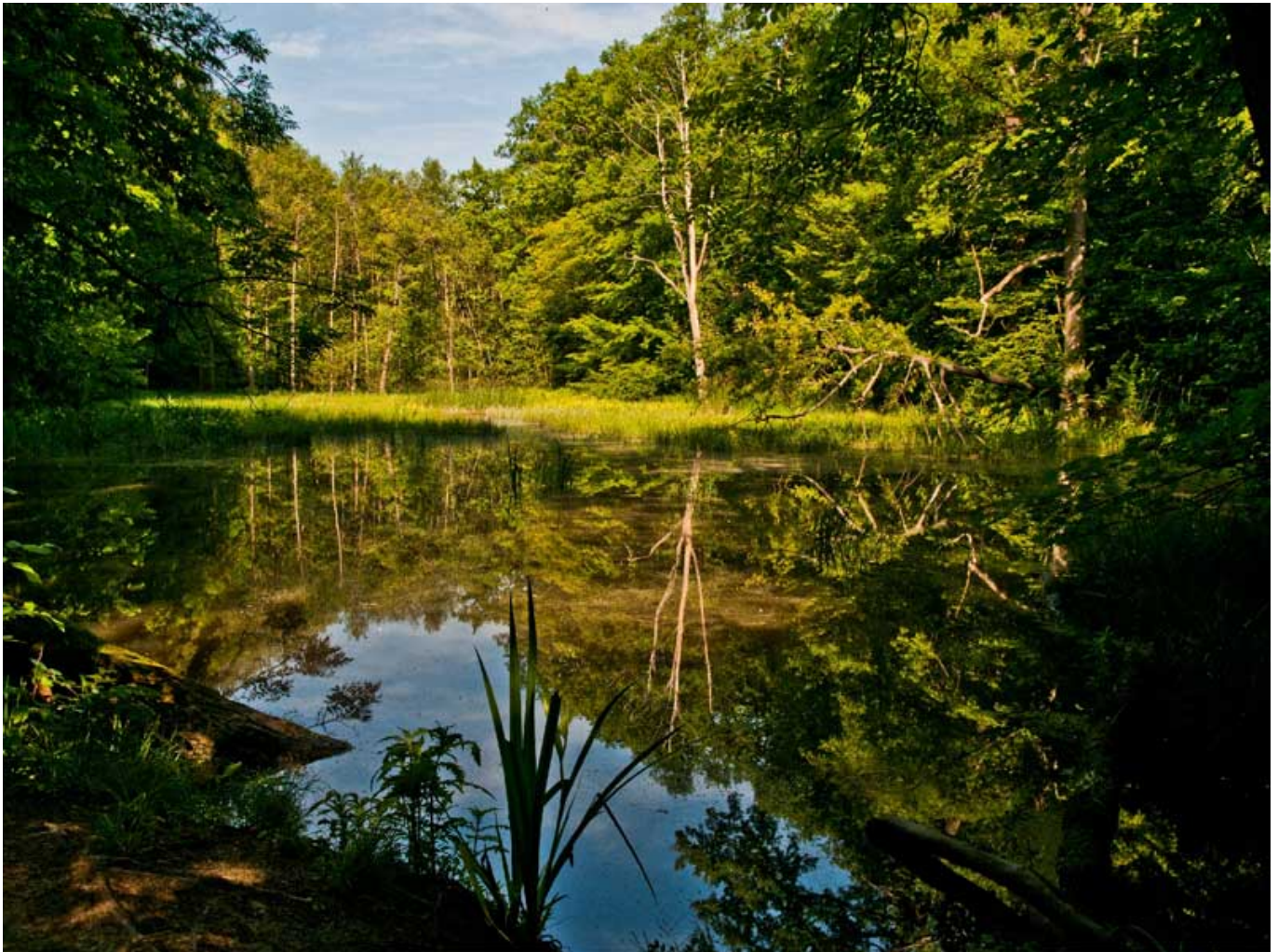
Kwaliteitsweg Hünenteichweg im Nationalpark Hainich