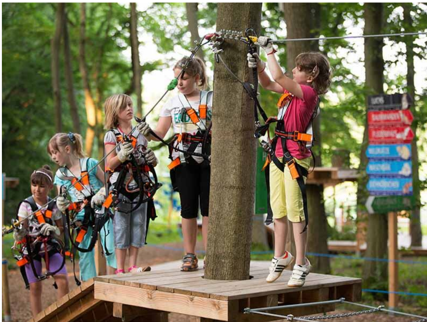
Kletterwald Hainich

Es ist das Ausflugsziel für Mutige in der Welterberegion: der Kletterwald Hainich . Mit 120 Kletterelementen in zehn Parcours sorgt er für reichlich Action, Spaß und Abenteuer.