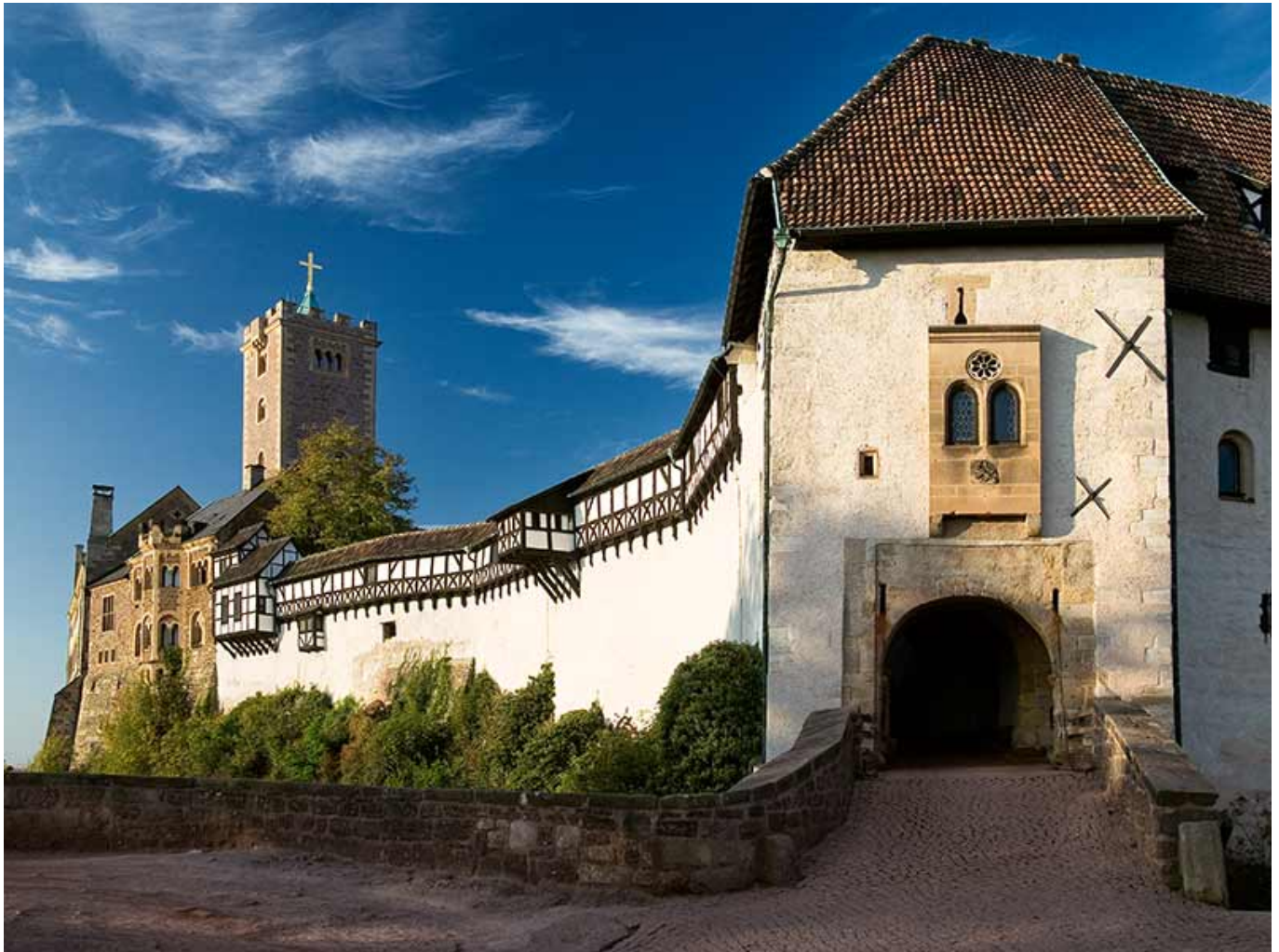
UNESCO Welterbe Wartburg